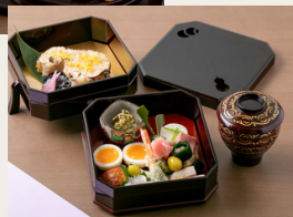
お子様向け京懐石

通常はDinner 1のご用意となりますが、 Dinner1の仕出し屋休業時(毎週水曜日と第三火曜日及び臨時休業時)はDinner2を提供いたします。