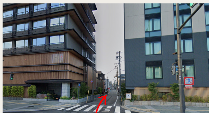
ダブルツリーホテル